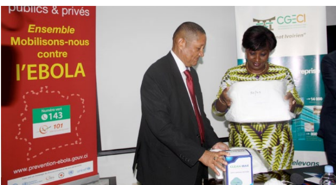
...des combinaisons ainsi que bien d'autres matériels