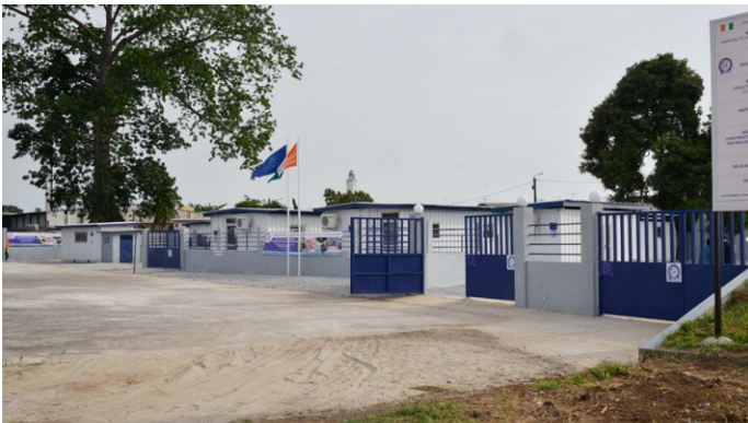
Bienvenue au CTE de Treichville