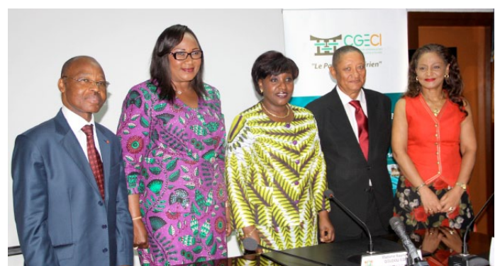
Photo de famille

Remontez-nous toutes les informations en écrivant à info@cicg.gouv.ci ou appelez le 20 31 28 28