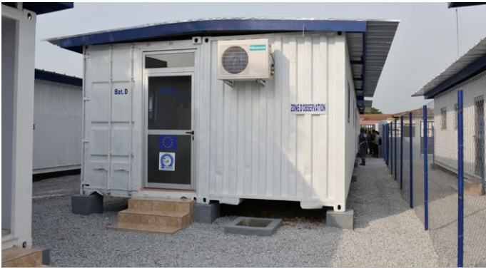
La zone d'observation