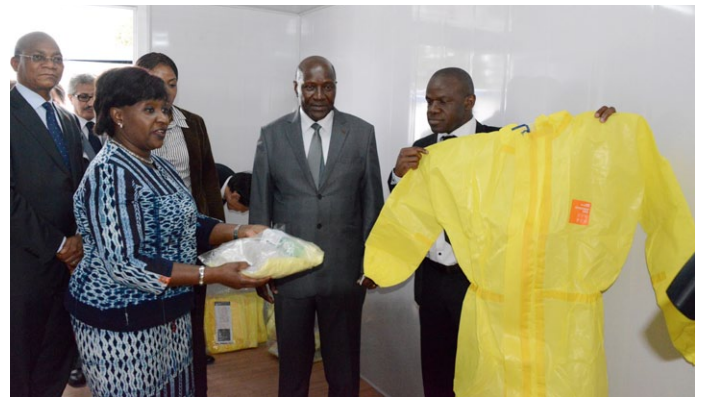
Le Premier ministre et les membres de sa délégation