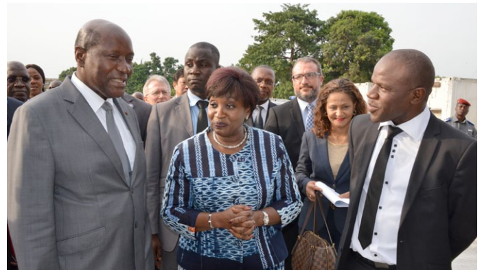
Le Premier Ministre accueilli par la Ministre de la Santé