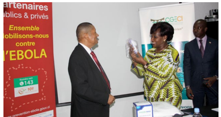
des pistolets thermiques à infrarouge...