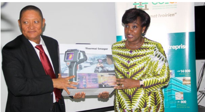
Remise symbolique au nom de la CGECI à la Ministre de la Santé, des scanners thermiques ...