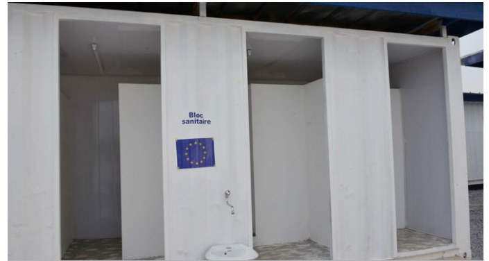
Le bloc sanitaire