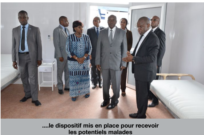
....le dispositif mis en place pour recevoir les potentiels malades